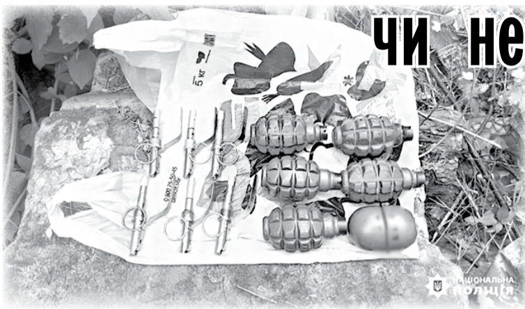
Боеприпаси, знайдені у сховку на кладовищі.