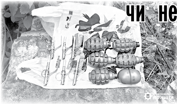
Боеприпаси, знайдені у сховку на кладовищі.