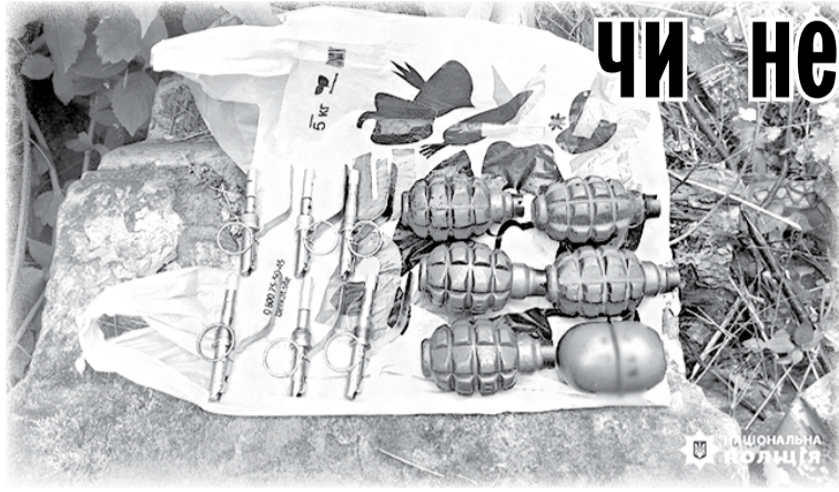
Боеприпаси, знайдені у сховку на кладовищі.