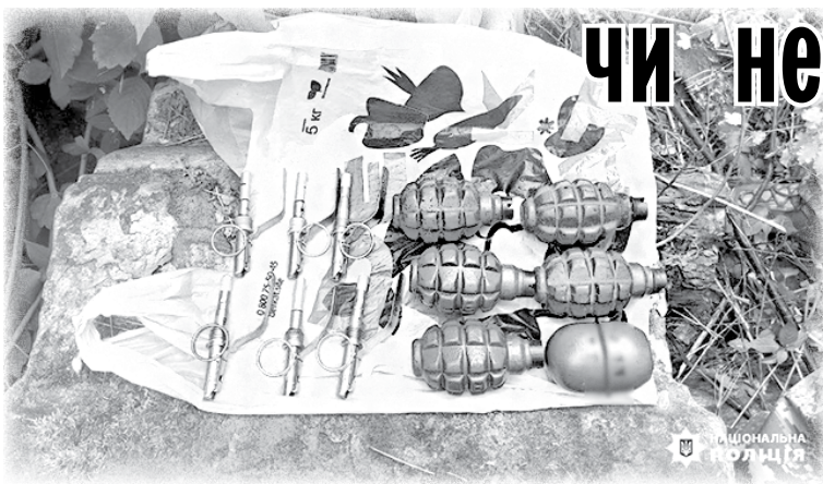
Боеприпаси, знайдені у сховку на кладовищі.