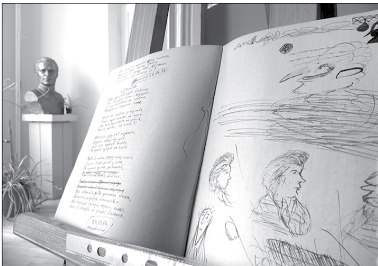
фото Романа КИРІВА

Хоч в українській міфології чоловік-русалка — дуже рідкісне явище. Русалки без причини нікого не лоскочуть. Вони — не «нечисть», і не тільки душі померлих, а й дбають про рясний світ, про врожай. Узгоджують життя людини з силами природи. За повір'ями, бачать