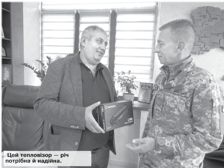
Цей тепловізор — річ потрібна й надійна.