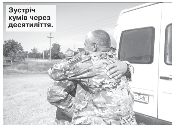
Зустріч кумів через десятиліття.