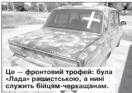
Це — фронтівий трофей: була «Лада» рашистською, а нині служить бійцям-черкащанам.

Василь МАРЧЕНКО, фото автора. Донецька область