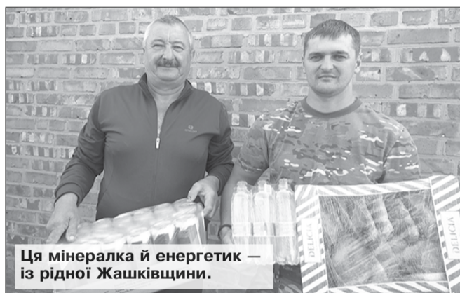
Ця мінералка й енергетик — із рідної Жашківщини.