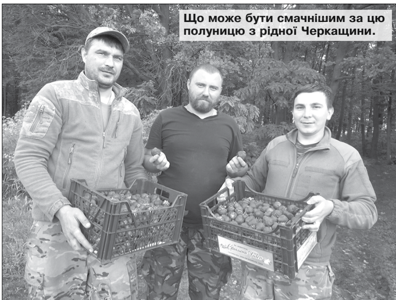
Що може бути смачнішим за цю полуницю з рідної Черкащини.