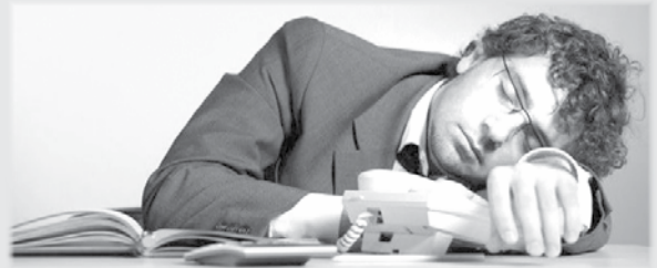
Сторінку підготували Наталя КУЦОП'ЯТ та Ольга СУСЬКА

При цьому важливо пам'ятати, що в зеленому чаї міститься аналог кофеїну — теїн. Тому його не варто пити на ніч.