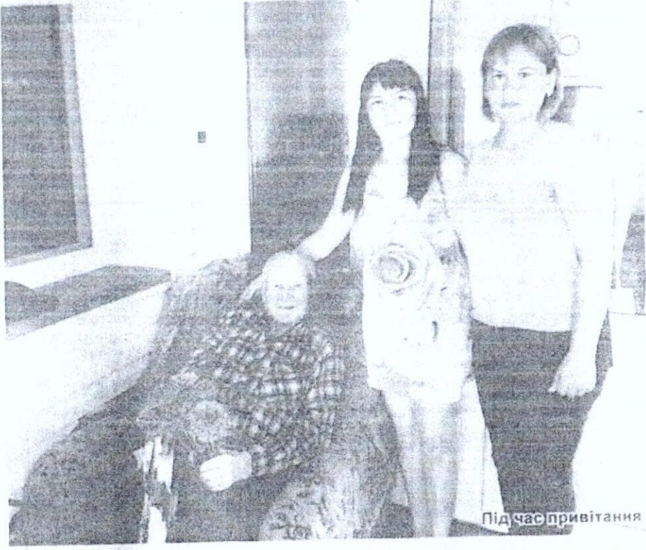
Під час привітання

У розбудові села, зведенні об'єктів соціального призначення є і його заслуга. А ще старожили