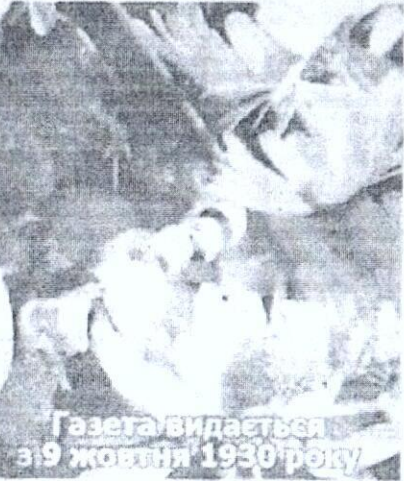
Газета видається з 19 жовтня 1930 року

ГРОМАДСЬКО-ПОЛІТИЧНЕ ВИДАВАННЯ ЗВЕНИГОРОДСЬКОГО РАЙОНУ