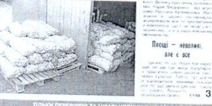
Тільки переверні та цікаві новини з усієї Черкащини читайте на www.kray.net.ua