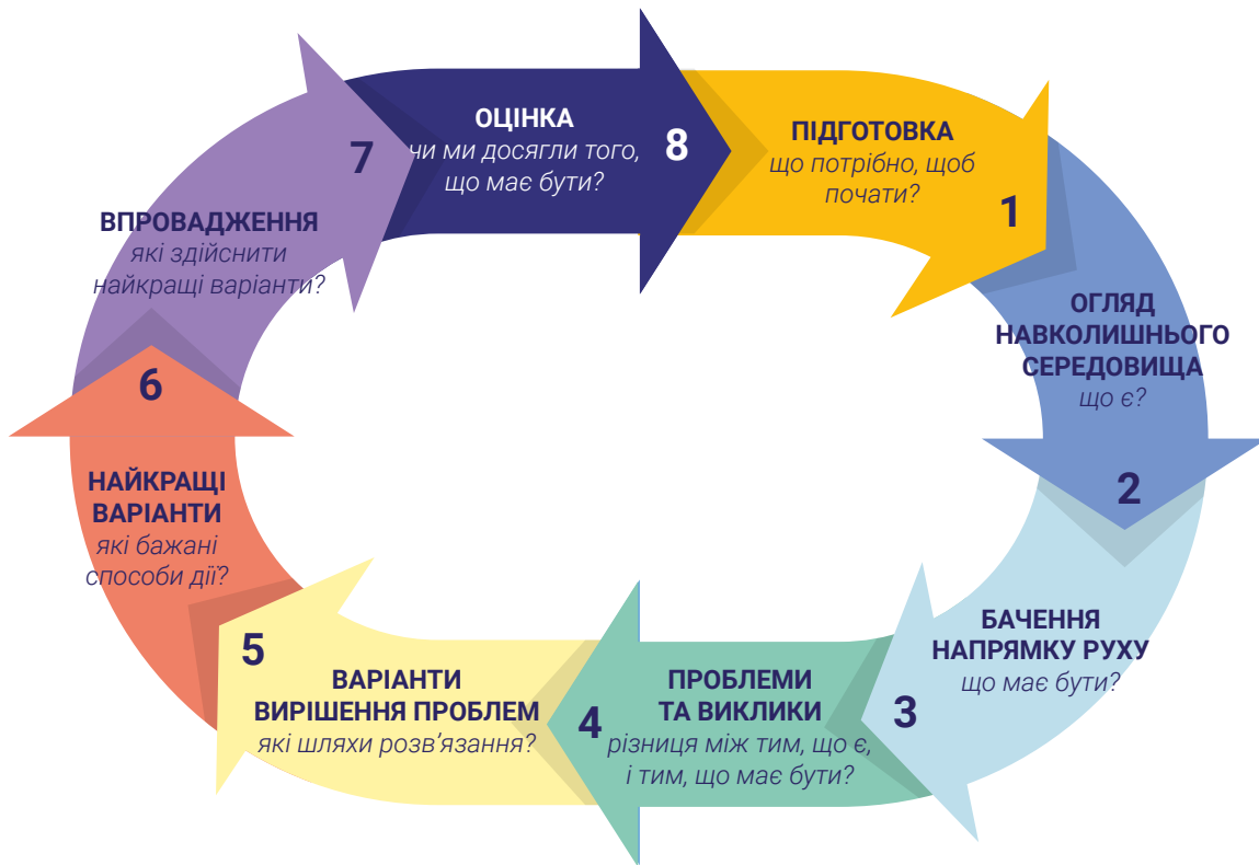
Рисунок 2 демонструє цикл прийняття рішень щодо розроблення Стратегічного плану. У Розділі 2 більш докладно зазначено про етапи та кроки, які необхідно впровадити для розроблення Стратегії.