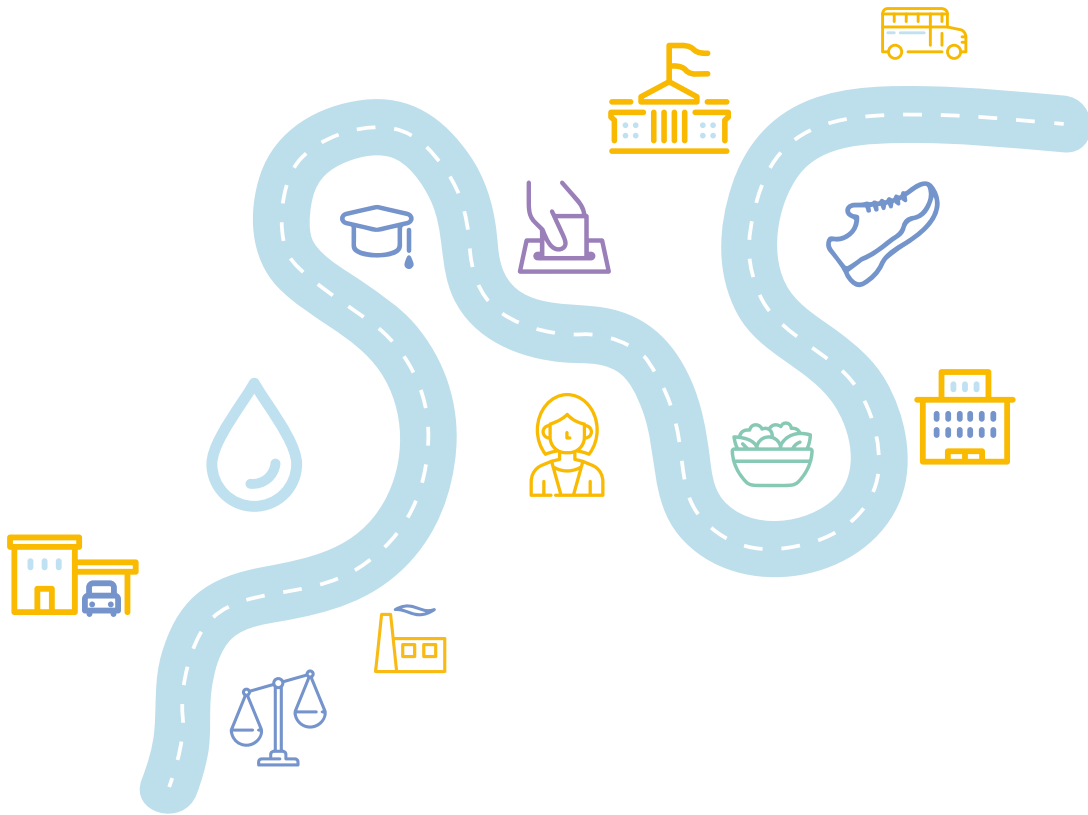
Рисунок 3. СОЦІАЛЬНІ ДЕТЕРМІНАНТИ ЗДОРОВ'Я

Соціальні детермінанти стосуються умов праці; процесів виключення окремих груп людей з участі в суспільному житті; питань ґендерної рівності; раннього розвитку дітей; глобалізації, яка впливає на здоров'я та виробництво; послуг охорони здоров'я; урбанізацію *** . Щоб врахувати потреби населення щодо здоров'я та благополуччя, для розроблення Стратегії розвитку ОТГ до робочої групи мають бути залучені фахівці системи охорони здоров'я та жителі громади.