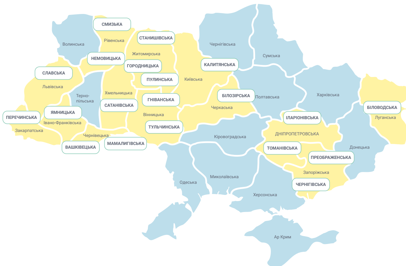
Рисунок 1. МАПА ОТГ, ЯКІ БРАЛИ УЧАСТЬ В ІНІЦІАТИВІ З РОЗРОБЛЕННЯ СТРАТЕГІЧНИХ ПЛАНІВ

За результатами ініціативи, у якій брали участь 20 ОТГ, 15 комунальних некомерційних підприємств із цих громад, що надають медичні послуги, розробили стратегічні плани, 73% відсотки (11 КНП) яких було затверджено органами місцевого самоврядування станом на 01 вересня 2019 р. Три ОТГ замість Стратегії підприємства розробили Стратегію розвитку охорони здоров'я в громаді, серед них дві Стратегії вже затверджено.