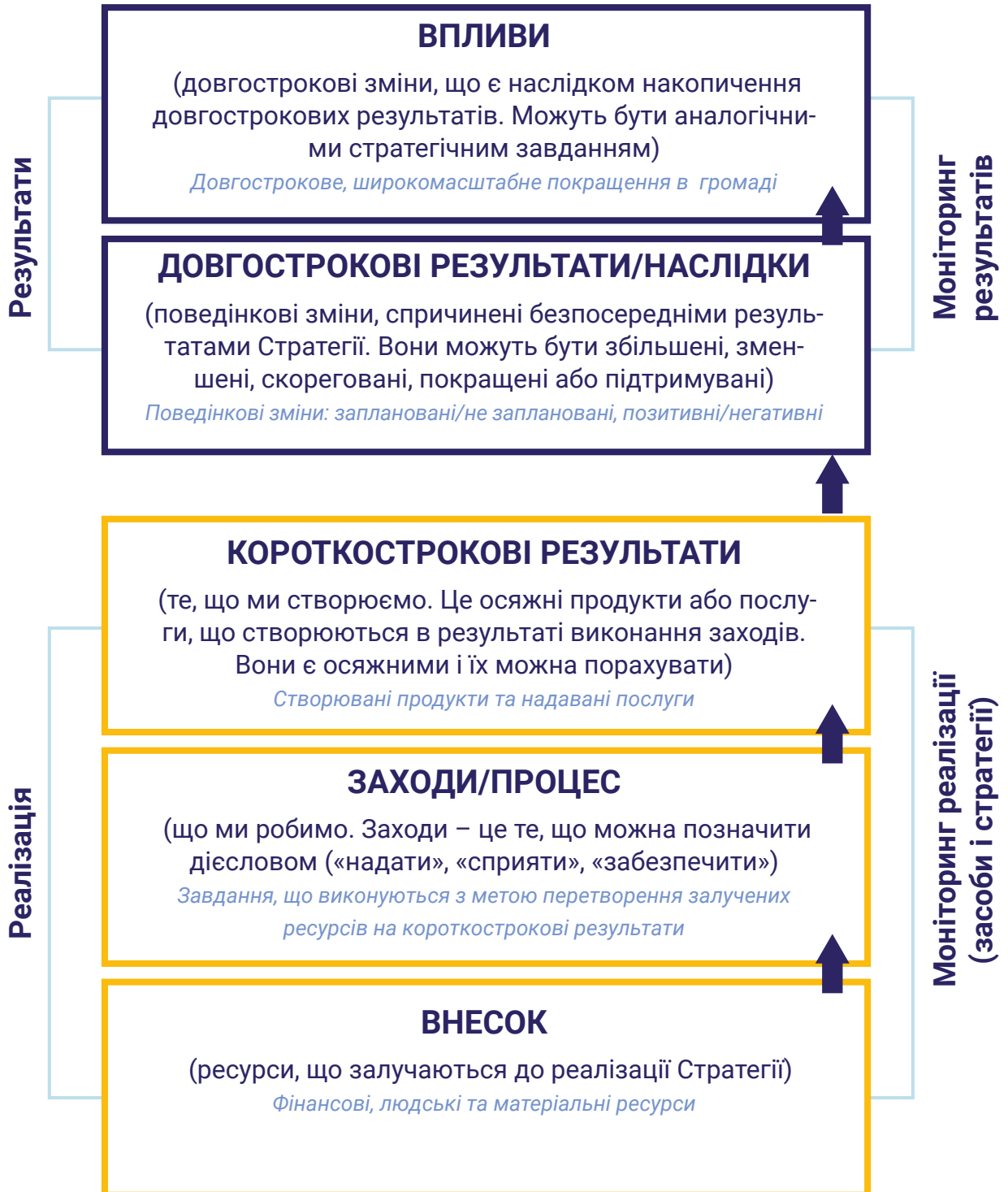
Рисунок 4. ВИДИ ТА РІВНІ МОНІТОРИНГУ ЗМІН